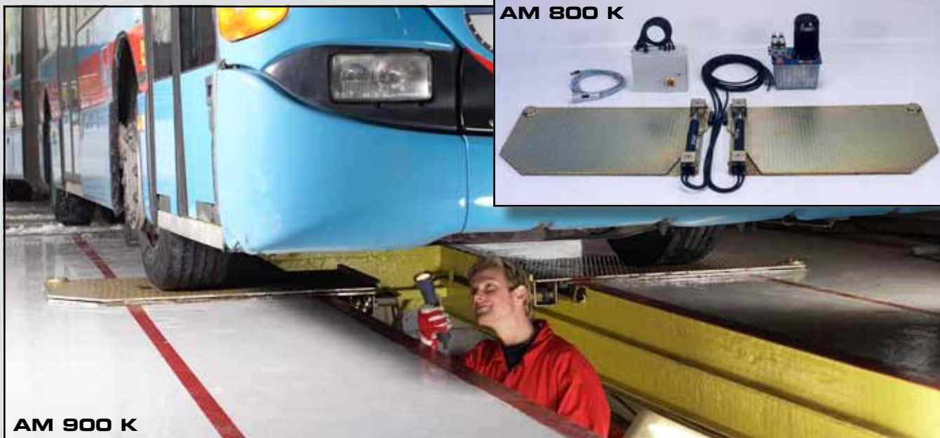
AM 900 K

Перед диагностикой и регулировкой колёс необходимо определить люфт всех элементов ходовой части.